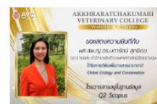
อาจารย์ส่วแพทย์ ได้รับการตีพิมพ์ ในวารสาร Global Ecology and Conservation 19/07/2021