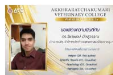
อาจารย์ส่วแพทย์ ได้รับการตีพิมพ์ ในวารสาร Acta Tropica 19/07/2021