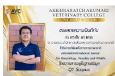
อาจารย์ส่วแพทย์ ได้รับการตีพิมพ์ ในวารสาร Parasites and Wildlife 02/09/2021