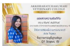
อาจารย์ส่วแพทย์ ได้รับการตีพิมพ์ ในวารสาร Acta Tropica 03/08/2021